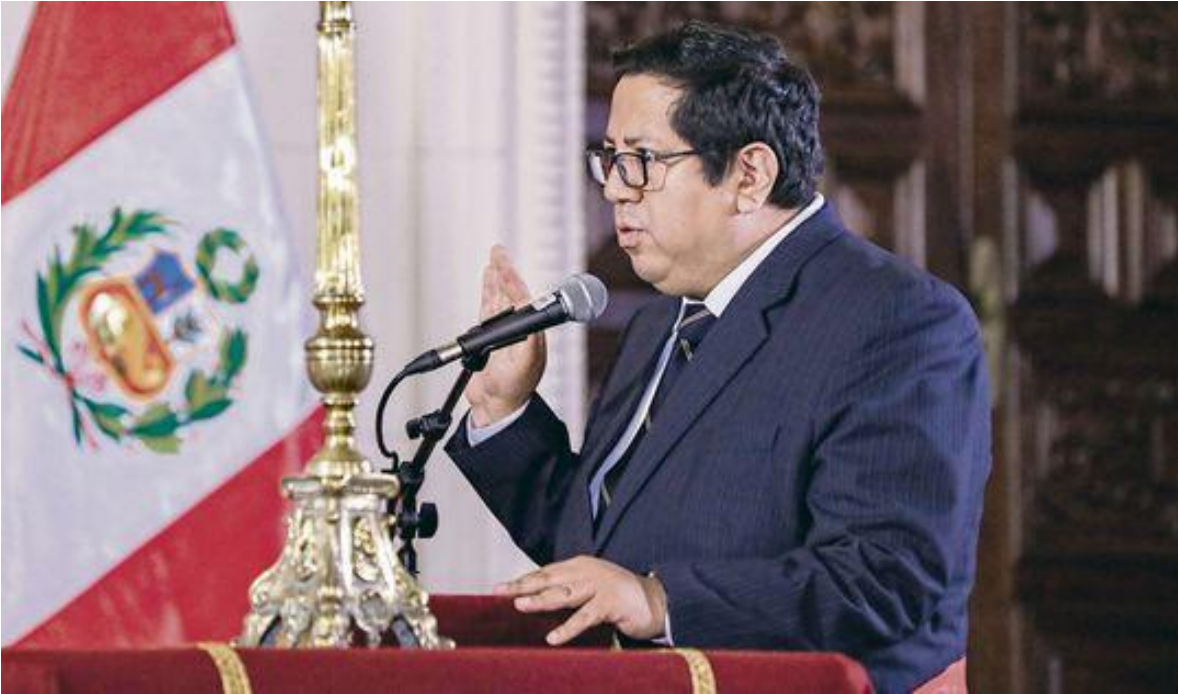
MEF. Alex Contreras Miranda, nuevo titular del Ministerio de Economía y Finanzas, fue viceministro desde agosto del 2021.

El general en retiro de la Policía César Cervantes es el ministro de Interior. Ha sido comandante general de la Policía en el gobierno de Francisco Sagasti .