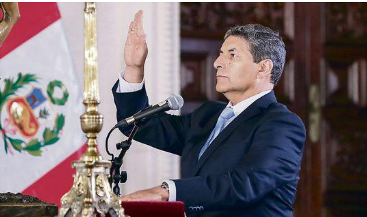
Mininter. En el despacho del Interior fue nombrado César Augusto Cervantes.

El general en retiro de la Policía César Cervantes es el ministro de Interior. Ha sido comandante general de la Policía en el gobierno de Francisco Sagasti .